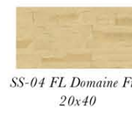
SS-04 FL Domaine Fine 20x40