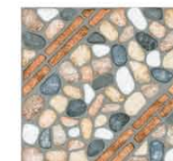
SS-11 Kahlua FL Beige

SEARAH JARUM JAM Komposisi natural dalam palet warna abu-abu; Motif batu alam yang tersusun grafis untuk hunian modern; Motif floral yang sangat serasi untuk aplikasi teras area hijau.